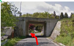
国道284号線をぐぐってすぐに左折。